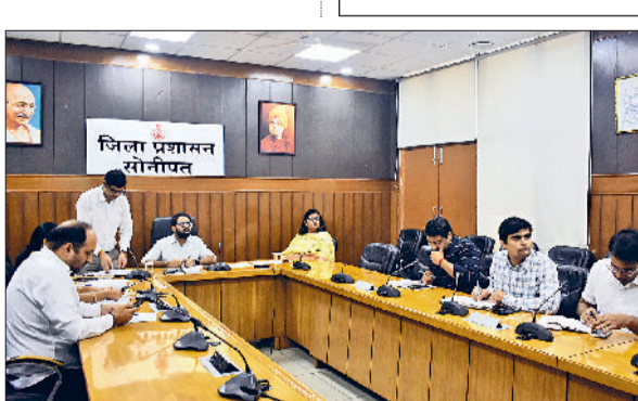
सोनीपत। अधिकारियों की बैठक लेते अतिरिक्त उपयुक्त लक्षित सरनी।

सोनीपत। नगर निगम द्वारा शहर की सड़कों में बने जानलेवा गट्टे को भरने का काम चल रहा है। निगम ने दो जौन बनाकर 25-25 लिटर के टेंडर लगाए थे और दो एजेंसियों ने गट्टे भरने का काम शुरू कर रखा है। अब तक सेक्टर 15 की डीएवी रोड, ओल्ड डीसी रोड, सूरी पेट्रोल पंप वाली गली, सेक्टर 23 वाली मुख्य सड़क, ककरोई रोड, गोहाना रोड, स्वामी विवेकानंद चौक से सेक्टर 14 -15, हिन्दू स्कूल रोड, खिजरा मकबरा जटवाड़ा, शनि मंदिर के पास, निकट एम्पी की कोठी, अम्बेडकर पार्क के सामने, गांधी चौक से सेक्टर 14 वाली रोड आदि के गट्टों को भरा जा चुका है।