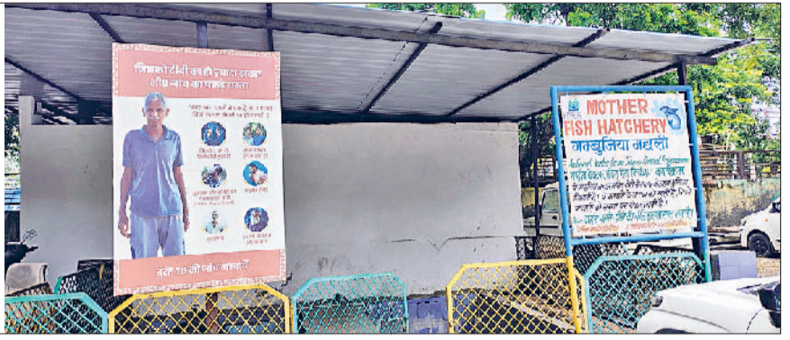
सोनीपत। परिसर में स्थित हैचरी व मौके का निरीक्षण करते पदाधिकारी व जिला स्वास्थ्य अधिकारी।