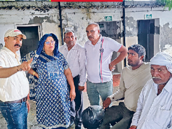
जिला स्वास्थ्य अधिकारी व फाउंडेशन के पदाधिकारियों ने जगह का दौरा किया।