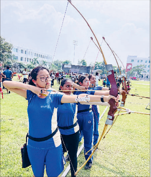
सोनीपत। पूर्ण मूर्ति ग्लोबल स्कूल में सीबीएसई नॉर्थ जोन-2 तीरंदाजी चैंपियनशिप के दौरान निशाना साधती तीरंदाजी