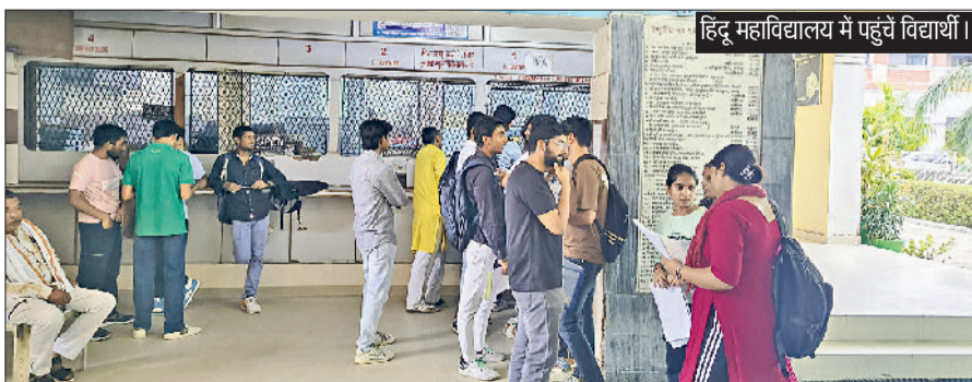
शुक्रवार से दाखिला लेने वाले विद्यार्थियों को अब 100 रुपये विलंब शुल्क के साथ ही प्रतिदिन 100 रुपये अतिरिक्त जुर्माना भी देना होगा। उच्चतर शिक्षा विभाग द्वारा दो चरणों में मेरिट लिस्ट जारी करने के बावजूद जिले के अधिकतर कॉलेजों में

जिले के सरकारी व एडेड महाविद्यालयों में दाखिले की रफ्तार अब भी धीमी बनी हुई है। उच्चतर शिक्षा विभाग द्वारा निर्धारित समय सीमा के तहत वीरवार को 100 रुपये विलंब शुल्क के साथ दाखिला लेने का अंतिम दिन रहा, जिस कारण कई कॉलेजों में विद्यार्थियों की भीड़ देखी गई। दाखिला लेने के इच्छुक विद्यार्थियों ने कॉलेजों में पहुंचकर दस्तावेज सत्यापन करवाए और फीस जमा करवाते हुए अपना दाखिला सुनिश्चित करवाया।