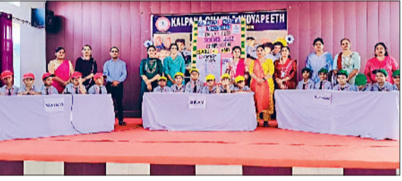
खरखौदा। प्रतियोगिता में भाग लेते विद्यार्थी।