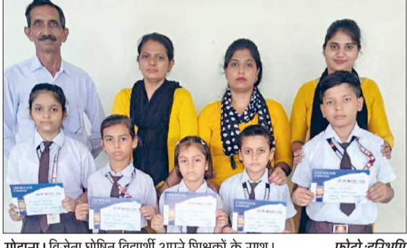
गोहाना। विजेता घोषित विद्यार्थी अपने शिक्षकों के साथ।