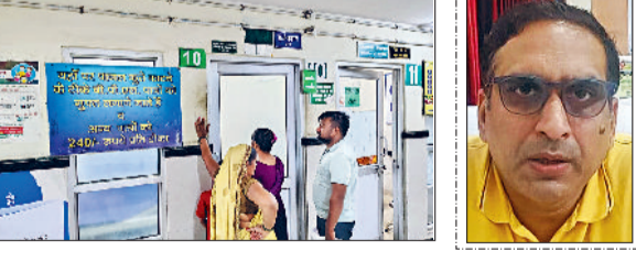
हरिभूमि न्यूज ॥ सोनीपत

नागरिक अस्पताल में बीते 12 दिनों से खत्म पड़े एंटी रैबीज इंजेक्शन आखिरकार उपलब्ध हो गए हैं। इससे मरीजों और उनके परिजनों ने राहत की सांस ली है। अस्पताल प्रशासन को मुख्यालय द्वारा भेजी गई ताजा खेप के तहत 12 हजार वायल भेजी है। जिसमें से सीएचसी स्तर पर पीएचसी स्तर पर वितरित करने का कार्य शुरू कर दिया है। विभाग की तरफ से करीब 60 हजार मरीजों के इंजेक्शन भेजे हैं। प्रबंधन की तरफ से इंजेक्शन खत्म होने से पहले ही डिमांड भेजी गई थी। जिसे उच्च अधिकारियों की तरफ से पूरा कर दिया है। इंजेक्शन